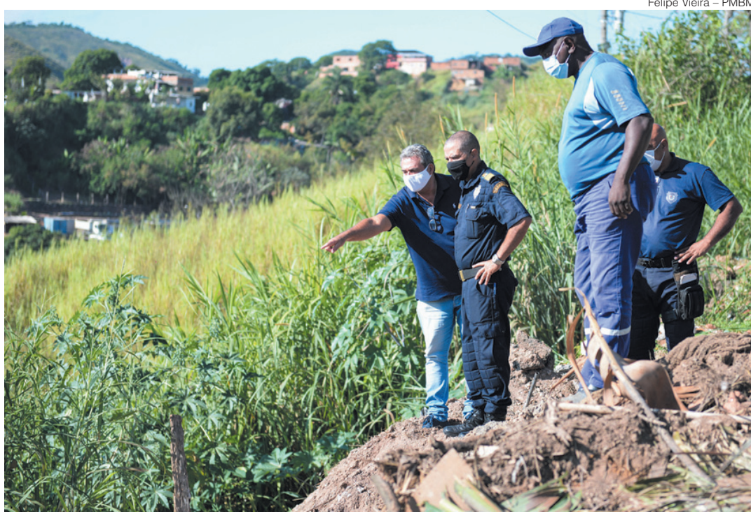
Equipe da prefeitura observa restos de caixões abandonados