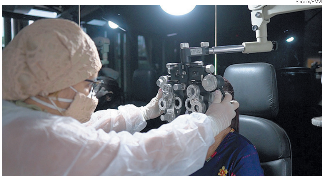
Moradora de VR faz exame de vista no Estádio da Cidadania