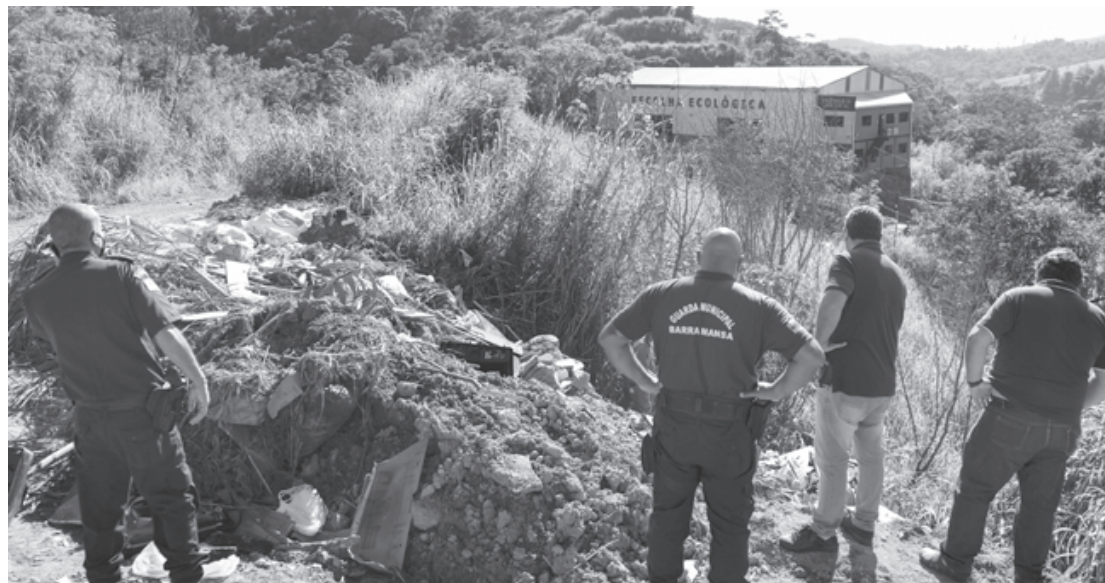
Caso foi encaminhado à delegacia para apuração