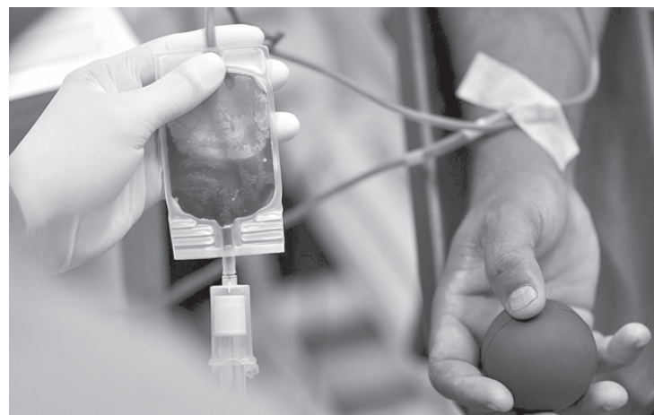
Banco de Sangue Municipal sofre com a queda no número de doadores por conta da pandemia da Covid-19

- Acredito que as pessoas estejam receosas por conta da pandemia, principalmente, pelo banco de sangue estar dentro de um hospital. Avisamos que o atendimento aos doadores respeita todas as normas sanitárias de prevenção ao contágio pelo novo coronavírus. O distanciamento social, a disponibilização de álcool 70%, a higienização das