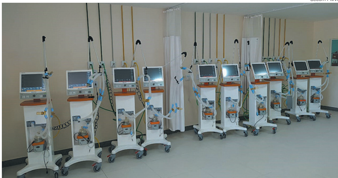
Respiradores serão usados no atendimento a casos graves de Covid-19