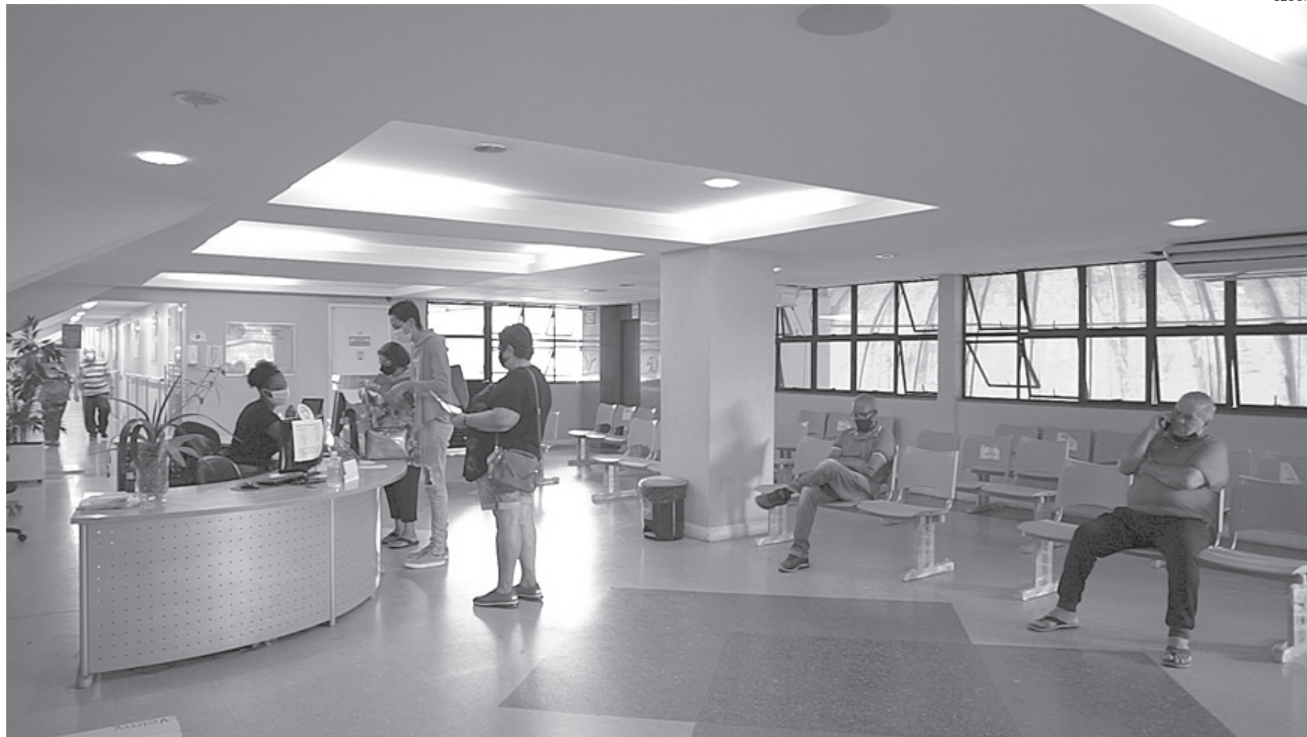
Policlínica presente no estádio realizou mais de 20 mil exames em 2021