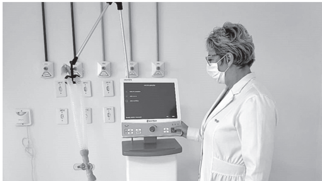
Aparelhos ficarão no anexo do Hospital do Retiro

Nesta etapa, foram preparados 30 leitos no anexo ao Hospital do Retiro, no prédio da FOA/UniFOA, no campus Leonardo Mollia. Passada a pandemia, os leitos ficarão de legado para a rede pública de saúde. Com a chegada dos equipamentos, a Prefeitura