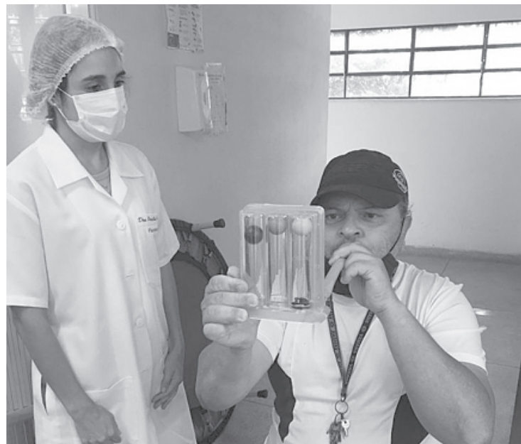
Tratamento fisioterapêutico é oferecido pela Clínica Municipal de Fisioterapia Carmem Vergetti Leite Franco

– Fiquei hospitalizado do dia 24 de março ao dia 5 de abril. Fiquei grave, sete dias na UTI, mas graças a Deus eu saí. Quando comecei a fazer fisioterapia estava com a saturação bem baixa, não aguentava nem andar, hoje já estou respirando melhor, com a saturação já controla-