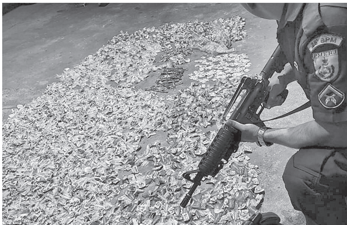
Material apreendido foi entregue na 93ª DP

Segundo a PM, ao todo, foram apreendidos 1823 pinos de cocaína de R$10,00; 360 pinos de cocaína de R$5,00; 634 pinos de cocaína de R$20,00; 173 pinos de cocaína de R$15,00; 530 pinos de cocaína de R$30,00; 150 sacolês de cocaína de R$3,00; 60 trouxinhas de maconha de R$10,00; 40 tiras de maconha de R$30,00; 175 tiras de maconha de R$5,00; 31 pedras de crack de R$10,00 e R$69,00 em espécie.